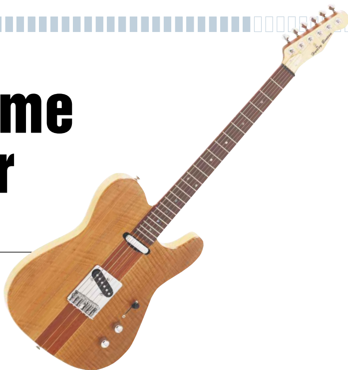
Harley Benton HBT2000

günstig und gut für Einsteiger und Fortgeschrittene