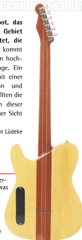
Durchgehender Hals für bestes Sustain.

Einsteiger und alte Hasen gleichermaßen könnten der HBT2000 etwas abgewinnen. Der Klang ist rund, klar und differenziert. Dabei ist die Gitarre aber so flexibel, dass sie bei traditionellen Sounds nicht stehen bleibt, sondern auch in modernen Stilrichtungen klasse klingt. Auch die außergewöhnliche Konstruktion und die tolle Optik heben die Harley Benton aus der Masse heraus. Nicht zuletzt der Preis macht die Harley Benton HBT2000 für so ziemlich alle Spieler interessant.