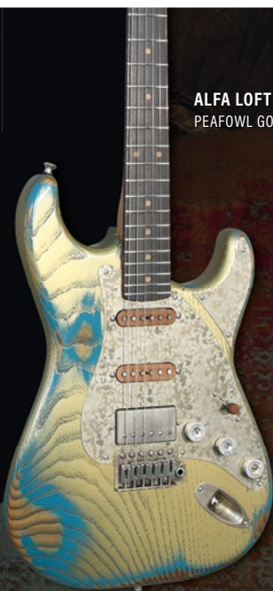
ALFA LOFT PEAFOWL GOLD