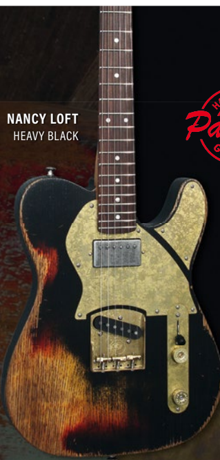
NANCY LOFT HEAVY BLACK