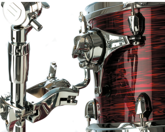
resonanzoptimierende SoniClear Tom-Halterung

Ahorn/Walnuss-Kessel bleibt natürlich erhalten, doch meiner Ansicht nach sind (vor allem die folierten) Saturn V MH Drums prädestiniert für den Einsatz in Rock und Metal. Der Klangunterschied ist nicht riesig, aber effektiv bemerkbar, und man kann die Drums bereits mit der werkseitigen Fellkombination auf diesen fetten und attackbetonten Sound hin stimmen. Insofern ist dieser kleine Unterschied zwischen den beiden Mapex Saturn V Drum-Varianten eine wirklich feine Sache, wird doch eine echte klangliche (und zudem auch etwas preisgünstigere) Alternative geboten. //