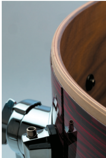
sauber geklebte Folie mit freilebenden Kesselrändern