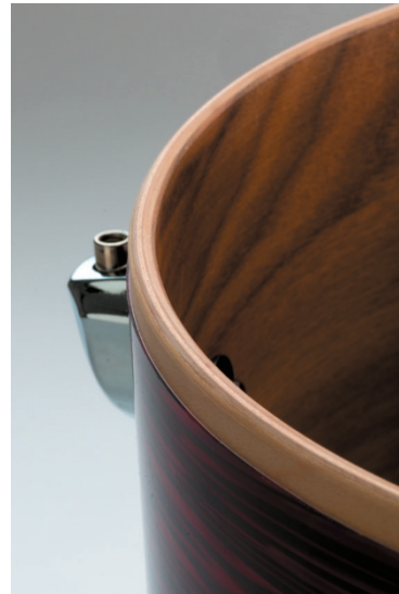
präzise geformte, rundliche SoniClear-Gratung