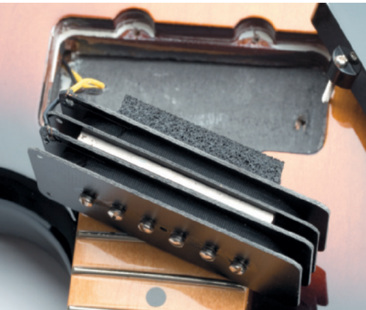
Offset Special JZHB Pickups

Wechseln wir das Instrument und hören was die Offset Special gegenzuhalten hat. Völlig andere Welt – das Klangverhalten dieses Modells ist stark geprägt von der Hollowbody-Konstruktion und natürlich durch die speziellen JZHB Humbucking Pickups, wel-