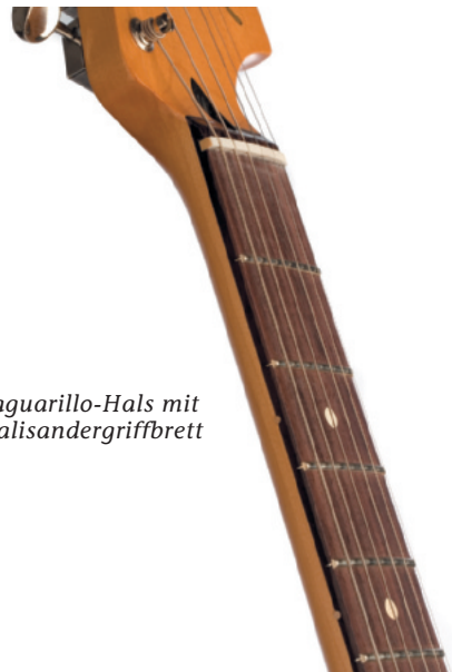
Jaguarillo-Hals mit Palisandergriffbrett

Gehen wir in den Verstärker, so überrascht die Jaguarillo mit sehr direktem Tonverhalten und starker Präsenz. Über den Fünfwegschalter lassen sich zudem bestens gestaffelte Klangfarben aufrufen. Die Singlecoils am Hals und in der Mitte versprühen schönes Strat-Flair; Der heiße Atomic Humbucker am Steg (Alnico-5-Magnete; 14 kOhm) kommt schon in klaren Einstellungen mit kraftvollem Schmack zum Ohr und seine kompakte, beeindruckend schlüssige Umsetzung von Akkorden macht mit zupackenden Biss dann im Overdrive einen richtigen Laden auf. Frech, unmittelbar und sehr beweglich lässt sich damit alles bedienen, was nach Rock schreit. Schalten wir in die Zwischenpositionen, so erfreuen uns zwei höchst brauchbare Kehl-Sounds, etwas