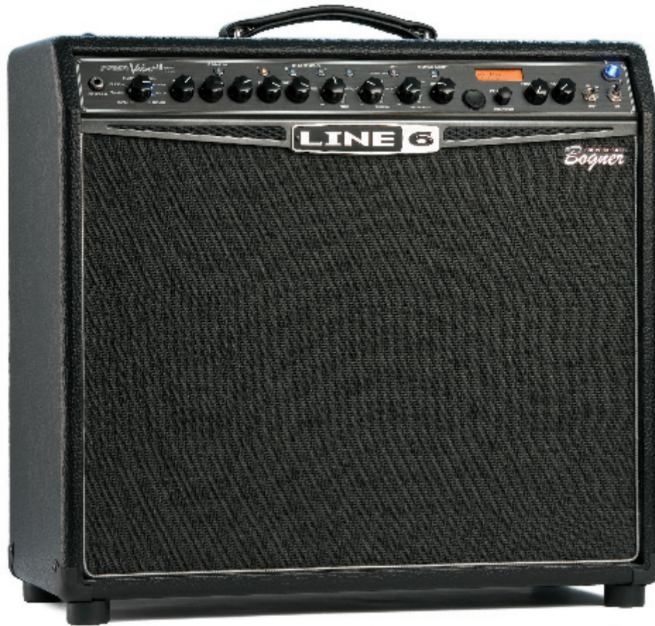
TEXT EBO WAGNER