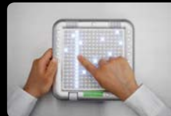
Noten werden über eine 16 mal 16 Buttons zählende Matrix eingegeben.

Die Idee des Tenori-on kann besonders elektronische Musiker nicht kalt lassen. Zehn Minuten damit herumgespielt, ist der Virus weitergetragen: Toshio Iwais Instrument verändert die Art und Weise, wie man über die Erschaffung von Musik denkt. Es ist intuitiv, es ist faszinierend, es begeistert, und es macht Spaß, Spaß, Spaß. Dabei sind die mitgelieferten Sounds sogar bisher noch recht mau, und auch technisch gibt es einiges zu bemängeln – wie oben auch geschehen. Nicht einmal die Ergonomie ist zu Ende gedacht – ein Colani hätte das Tenori-on selbst wohl griffiger gestaltet, vielleicht weit- aus konsequenter an die Form der Hände angepasst. Doch auf alle diese letztlich kleinlichen Kritikpunkte muss schlussendlich schwer wie ein Mühlstein der scharfe Tadel des verehrungswürdigen Pioniers fallen: Das Tenori-on will ein erstes Konzept sein, eine endlich ernst gemeinte Skizze für einen Aufbruch in ein neues Instrumenten-Zeitalter. Und wer es in die Hand bekommt, den verführt es und macht es zu einem neuen Musiker. Schon jetzt. ■