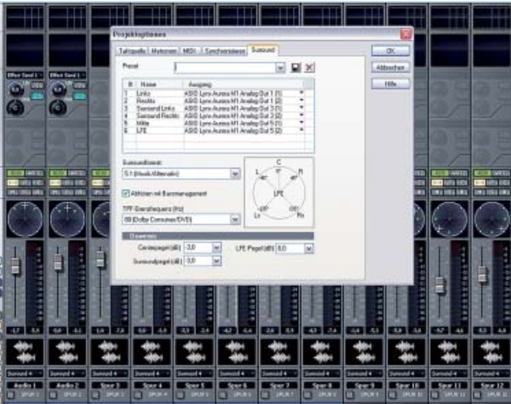
Alle aktuellen Sequenzer-Programme ermöglichen Surround-Mischungen in den verschiedensten Formaten. Für die verschiedenen Formate enthält beispielsweise Sonar diverse Presets: Der Screenshot zeigt das für den Praxistest ausgewählte Preset/Format. Die Lautsprecher sollten möglichst entsprechend der Grafik aufgestellt sein.

Controller noch verzichtet werden kann, ist die Anschaffung eines solchen Geräts für Surround praktisch Pflicht. Bei Professional audio Magazin kommt hierfür derzeit der SPL SMTC 2489 zum Einsatz, denn er bietet unter anderem die Möglichkeit, zur Korrelationskontrolle die Front- und Rückkanäle auf mono zu schalten. Beim Test des Genelec-Systems ist der Lynx Aurora 8 und der SACD-Player NAD M5 mit dem SMTC 2489 verbunden.