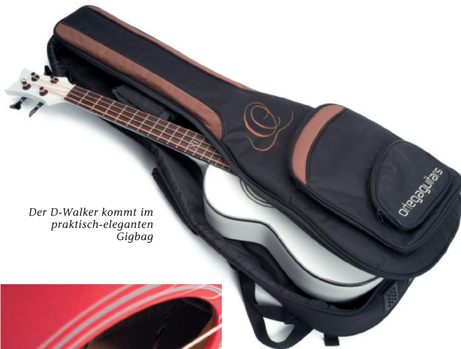
Der D-Walker kommt im praktisch-elegantem Gigbag

Vertrieb: Taranaki Guitars, 73760 Ostfildern www.taranaki-guitars.de Preis: ca. € 220 ■