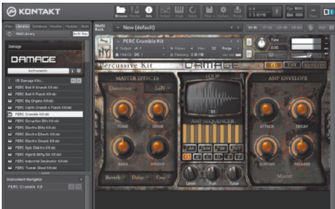
NI Damage Hersteller/Vertrieb Native Instruments UVP 299,- Euro www.native-instruments.de