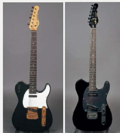
Seltene ASAT: Eine Classic Black & Gold Leo Fender Signature