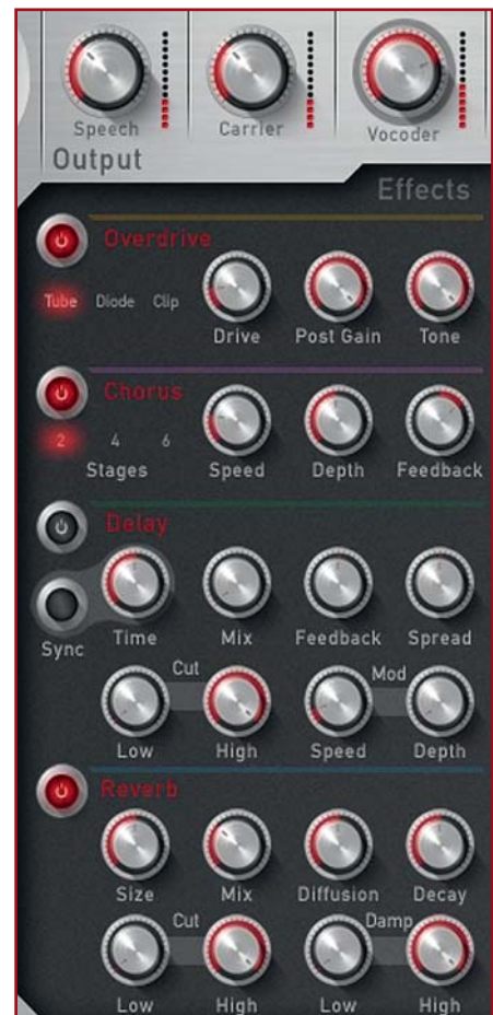
Vier Effekte sorgen hinter der Vocoder-Sektion und vor dem Ausgang für ein Verfeinern des Gesamtsounds. Über den Speech-, Carrier- und Vocoder-Reglern ist die Lautstärke des entsprechenden Signalanteils separat einstellbar.