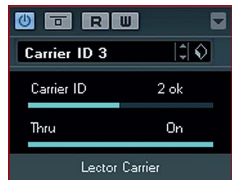
Das separat ladbare Carrier-Plug-in stellt ein Routing zum Sidechain-Kanal von Lector her. Es kommt ausschließlich beim Einsatz von Lector im VST2-Betrieb zum Einsatz.