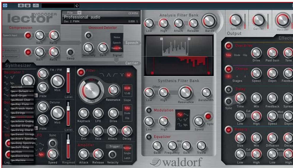
Das Vocoder-Plug-in Lector erlaubt das Einspeisen von zwei Signalen, wobei der Modulationsverlauf des Speech-Signals auf das Carrier-Signal aufgeprägt wird. Außer den Kernfunktionen zum Einstellen und Verfeinern des Vocoder-Signals, wartet Lector mit einem waschechten On-Board-Synthesizer sowie einer Multieffekt-Sektion am Ende der Signalkette auf.

tern die Gestaltungsmöglichkeiten noch einmal. Das integrierte Filter wartet mit den wählbaren Filter-Charakteristiken Hoch-, Tief- und Bandpass sowie Bandsperrung in je zwölf und 24 Dezibel-Charakteristik auf, plus das bereits erwähnte Whitening-Filter. Anders als die übrigen Filter lässt sich dabei jedoch nur das Cut-off eines dem Whitening-Filter nachgeschalteten Sechs-Dezibel-Tiefpasses und die Filterverzerrung einstellen. Im Test punktet dieses Filter auf markante Art. Der Sound klingt auf eigentümliche Art höhenreicher und schlanker, was übrigens auch für andere obertonreiche Sounds gilt. Sinn und Zweck: Das Vermeiden überlauter Klangspektren im Vocoder-Sound bei Einsatz von Chor-Samples, was tatsächlich zu einem hörbar homogeneren Ergebnis führt. Allerdings dürfte der Grundsound des Lector-Syn-