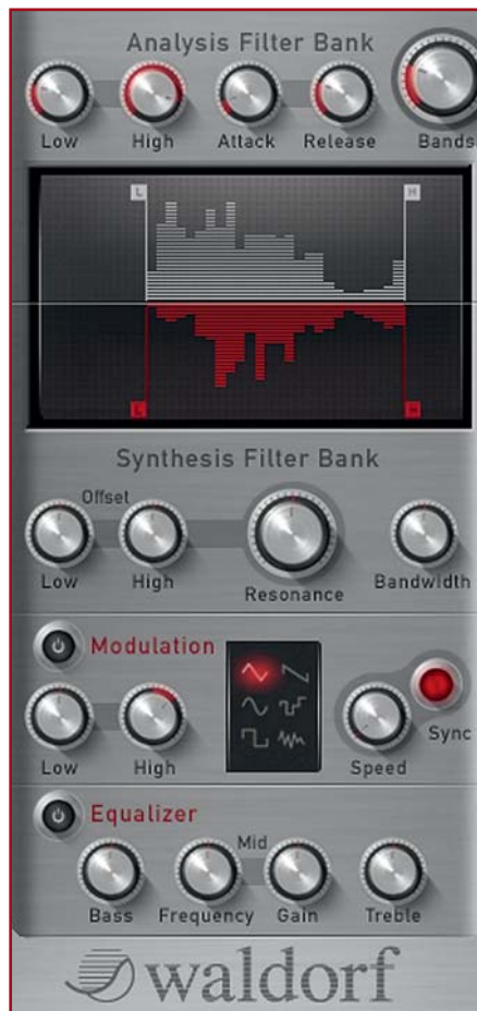
Die Filterbank-Sektion wartet mit teils pffigen Features auf. So lässt sich die Zahl der Filterbänder einstellen, die Bandbreite des Frequenzspektrums von Analyse- und Synthese-Filterbank eingrenzen und letztgenannte sogar modulieren.

Last but not Least hat Waldorf seinem Vocoder eine Effekt-Sektion spendiert, bestehend aus den einzeln aktivierbaren Effekten Overdrive, Chorus, Delay und Reverb, die sich zwischen Vocoder-Sektion und Ausgang ansiedeln. Ausstattung und Klangqualität sind ordentlich, wobei