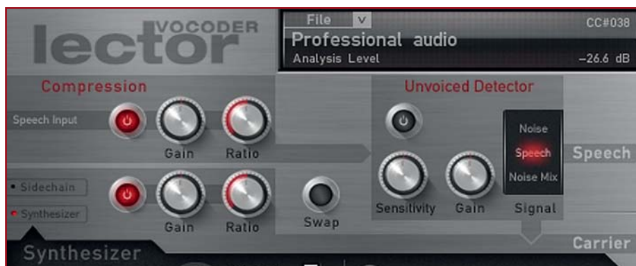
Speech- und Carrier-Signale lassen sich über einen rudimentär einstellbaren Kompressor in der Dynamik zügeln, um unerwünschte Lautstärkesprünge im Vocoder-Signal zu vermeiden. Über die Unvoiced-Detector-Sektion lässt sich beim Auftreten von Transienten/Konsonanten weißes Rauschen einfügen anstelle des Carriersignals.