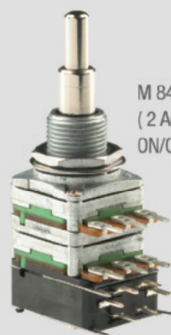
M 84110: Duplo Pull/Push Poti (2 Achsen, 2 Widerstandsebenen*, ON/ON, DPDT-Schalter)

* Widerstandsebenen in verschiedenen Ohm-Werten erhältlich