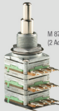
M 87114: Multifunktions-Poti (2 Achsen, 3 Widerstandsebenen*)