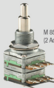
M 85052: Duplo Poti (2 Achsen, 2 Widerstandsebenen*)