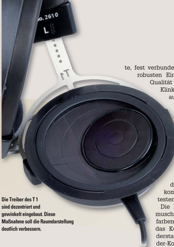
Die Treiber des T 1 sind dezentriert und gewinkelt eingebaut. Diese Maßnahme soll die Raumdarstellung deutlich verbessern.

Wer jetzt allerdings befürchtet, dass der T 1 eher auf Effekthascherei setzt, darf sich entspannen: Das Vorbild für den T 1 ist der berühmte DT 880, der sich, wie bereits eingangs erwähnt, durch seine Neutralität, also einen nahezu verfärbungsfreien und ausgewogenen Klang auszeichnet. Im Falle des Enkels T 1 erlaubt der ringförmige Magnet eine zentrale Bohrung direkt hinter der Membran-Mitte, um klangverfälschende Resonanzen zu minimieren. Auch die mehrschichtige, ebenfalls für den T 1 neu entwickelte Membran selbst soll unerwünschte Partialschwingungen und damit Verzerrungen wirkungsvoll unterdrücken. Dazu trägt schließlich auch die Bauweise als Vollmetall-System bei, denn damit sei ein Mitschwingen des Gehäuses verhindert, so dass beim T 1 „nur eines die Membran zum Klingen (bringt), und das ist das Musiksignal selbst.“, wie Gebhardt betont.