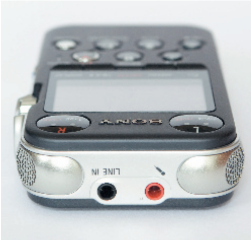
Die Mikrofonkapseln haben Kugelcharakteristik und sind am oberen Rand nach außen schielend eingebaut.