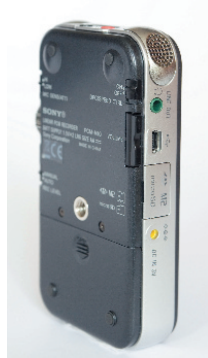
Mitgedacht: Der Kopfhörerausgang lässt sich auf Line-Level umschalten; der Kartenslot akzeptiert Memory Stick Micro und MicroSD-Medien.

Auskunft über den verbleibenden Headroom gibt. Gepegelt wird nicht wie bei vielen Konkurrenzprodukten über Tipptaster, sondern über ein richtiges Gain-Poti, das sich an der rechten Flanke befindet und von oben wie von unten mit dem Daumen erreichbar ist. So lässt sich notfalls noch während der Aufnahme die Vorverstärkung nachjustieren. Auf der Unterseite des Geräts befindet sich direkt oberhalb des Gain-Rändelpotis ein Schiebescalter für eine grobe Einstellung der Mikrofonempfindlichkeit (Hi/Low). Unterhalb des Gain-Potis lässt sich zwischen manueller und automatischer Aussteuerung umschalten. Diese wichtigen Funktionen sind also ohne Hangelei durch Menüs und Untermenüs direkt zugänglich – sehr gut! Ein (digitaler) Limiter, der vor Übersteuerungen bis etwa +12 dB schützt und ein Low-Cut sind leider nur über die Menüsteuerung zu erreichen.