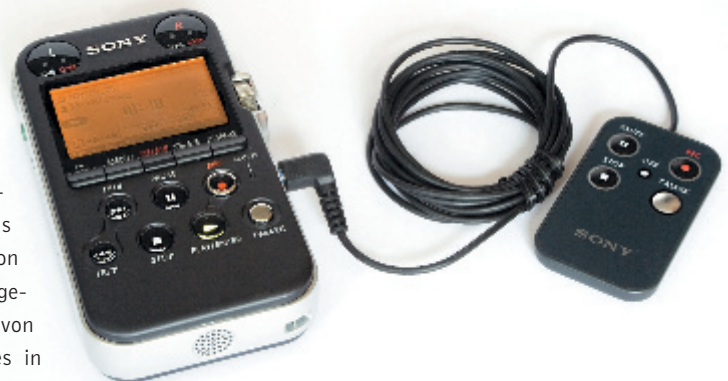
Eine kabelgebundene Fernbedienung gehört zum Lieferumfang.

meinem Zoom H2 häufig passiert). Außerdem lassen sich mittels einer Hold-Funktion alle Bedienelemente blockieren, sodass das Gerät im letzten Betriebszustand verharrt, bis die Hold-Funktion wieder deaktiviert wird. So lässt sich z. B. verhindern, dass eine Aufnahme unbeabsichtigt gestoppt wird. Auch viele andere Details verraten ein gutes Auge für die Praxis. Auf der Unterseite befinden sich kleine Gummifüßchen, die das Gerät auf glatten Tischplatten rutschfest machen und ein wenig von der Auflagefläche entkoppeln. Auch eine Stativbefestigung hat man nicht vergessen. Sie befindet sich an der Unterseite in der Nähe des Schwerpunkts; das Gewinde ist für Fotostative ausgelegt und besteht, anders als bei einigen günstigeren Field-Recordern, aus Metall.