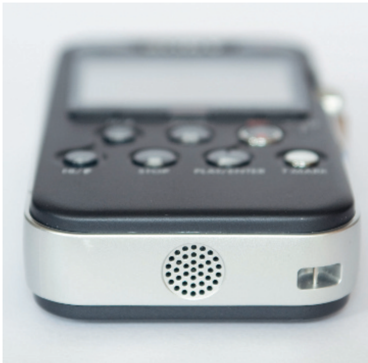
Praktisch: Zum kopfhörfreien Kontrollieren von Aufnahmen ist im unteren Rand ein Minilautsprecher eingebaut.

Bei den Speichermedien hatte Mr. Sony ein Einsehen mit den gestressten Reportern. Der Kartenslot des PCM-M10 schluckt nicht nur die proprietären M2 Memory Stick Micro, sondern auch MicroSD-Karten, die gemeinhin leichter und billiger zu beschaffen sind, da sie in unzähligen Handys und MP3-Playern zum Einsatz kommen. Darüber hinaus verfügt der kleine Sony über einen üppigen internen Speicher von 4 GB (!). Zusammen mit den maximal 16 GB der Speicherkarte kommt man also auf eine Kapazität von satten 20 GB! Der PCM-M10 bietet sogar „Cross Memory Recording“: Wenn bei die Speicherkarte überläuft, wird die Aufnahme automatisch im internen Speicher fortgesetzt. Tolle Sache, denn so hat man in unerwarteten Situationen eine üppige Sicherheitsreserve und muss sich keine Sorgen machen. Eine 16-GB-Karte bringt es in der höchsten Audioauflösung von 96 kHz/24 Bit (PCM unkomprimiert) auf 7 Stunden und 45 Minuten und in der höchsten Kompressionsstufe MP3 mit 64 kbps, 44,1 kHz auf fast 560 Stunden. Das sollte fürs Erste reichen – und wenn nicht, bleibt ja noch der interne Speicher!