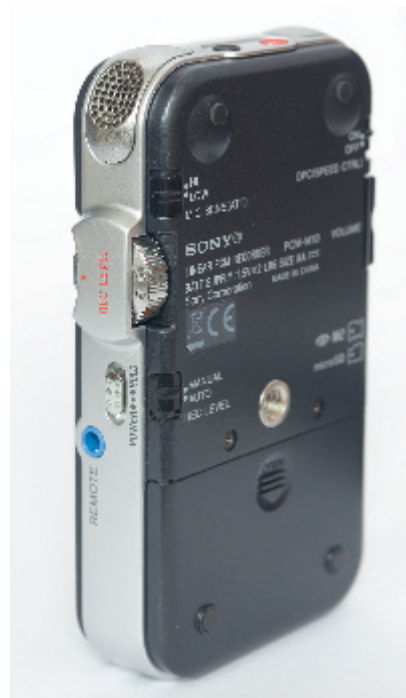
Der Aufnahmepegel wird nicht über Tipptaster, sondern über ein richtiges Rändelpoti justiert.