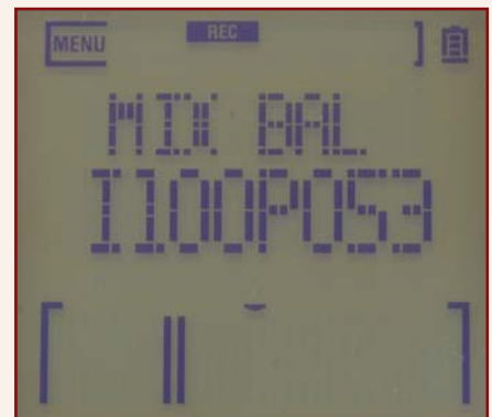
Beim Aufnehmen kann die Balance zwischen Playback und Aufnahmesignal fließend verstellt werden.

direkt auf CD brennen. Natürlich lassen wir es uns nicht nehmen die Weiterbearbeitung auszuprobieren. Der Import der finalisierten Files gelingt problemlos und wir können das Layout zu einem amtlichen Mix aufbereiten.