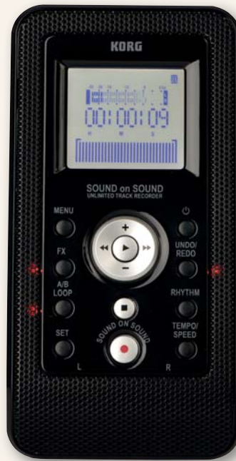
Die wichtigsten Funktionen sind unmittelbar über Buttons auf der Oberseite abrufbar. Der innovative Touchscreen-Fader steht zur intuitiven Justierung vieler Parameter (hier: Songposition) zur Verfügung.

Die Aufnahmemöglichkeiten – schließlich hat der Recorder mit der Overdub-Funktion sowie der Rhythm- und FX-Sektion einige Trümpfe im Ärmel – erschließen sich am besten anhand eines praktischen Beispiels. Aber vorab noch kurz ein paar Worte zu den Messwerten: Die Eingangsempfindlichkeit des Mikrofoneingangs geht mit -48,5 Dezibel mehr als in Ordnung. Um bei externen Mikrofonen auf der rauschfreien Seite zu sein, empfiehlt es sich aber dennoch empfindliche Kondensatormikrofone mit geringem Eigenrauschen zu verwenden. Geräusch- und Fremdspannungsabstand liegen mit 76,2 und 75,5 Dezibel im satt grünen Bereich und können problemlos mit deutlich teureren Recordern wie dem Zoom H4n (Test, 5/2009: 74,8 und 72,8 Dezibel) oder dem DR-100 von Tascam