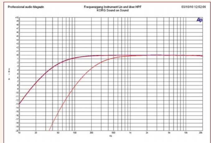
Der Frequenzgang des Instrumenteneingangs fällt unterhalb von 200 Hertz bis auf -7 Dezibel bei 20 Hertz ab, was besonders Bassisten nicht unbedingt freuen wird. Der Trittschallfilter wirkt bereits ab 180 Hertz.