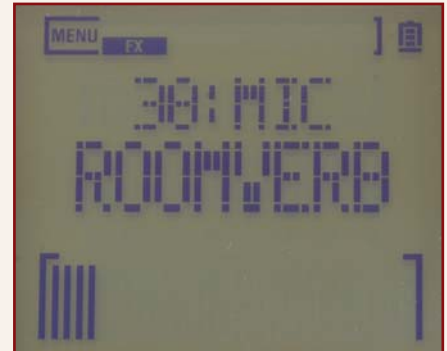
Bei allen Effekt-Presets ist immer ein wichtiger Parameter unmittelbar mit dem Touchscreen-Fader bedienbar.