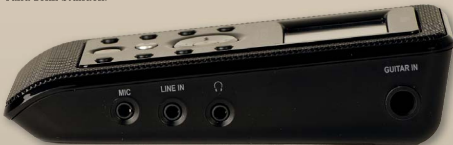
Alle analogen Ein- und Ausgänge (Mic, Line, Instrument, Kopfhörer) befinden sich an der rechten Flanke des ergonomisch geformten Keil-Recorders.

Der Sound on Sound braucht etwa 15 Sekunden bis alle Aggregate hochgefahren sind, was den O-Ton-Jäger in stressigen Aufnahmesituationen mitunter auf einen harte Nervenprobe stellt. Einmal hochgefahren, ist der kleine Track Recorder aber direkt einsatzbereit. Es ist nicht einmal eine Eingangsauswahl – je nachdem, ob man mit dem internen, einem externen Mikrofon oder über den Instrumenteneingang aufnehmen will – zu treffen. Da ist der Sound on Sound sehr unkompliziert und folgt einer klaren Hierarchie: Instrument (E-Gitarre, E-Bass), Line, externes Mikrofon und internes Mikrofon. Sind alle Buchsen belegt, ist folglich der Instrumenteneingang aktiv. Ist eine Line-Quelle und ein externes Mikrofon angeschlossen, hat die Line-Quelle Vorrang. Im Input-Menü gibt es aber selbstverständlich noch ein paar Konfigurationsmöglichkeiten, die je nach Aufnahmesituation und individuellen Präferenzen sehr hilfreich sind: Wer bei Aufnahmen beispielsweise in puncto Aussteuerung auf Nummer sicher gehen will – ein Auto-Limiter ist sowieso immer aktiv –, bedient sich zusätzlich der Auto Gain Control. Manuelles Pegeln ist für Individualisten aber ebenfalls möglich. Die Plus- und Minustasten der Navigationswippe regeln dann die Eingangsverstär-