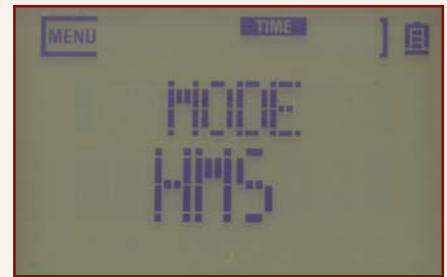
Im HMS-Mode werden Stunden, Minuten und Sekunden angezeigt. Alternativ können auch Takte, Schläge und Viertelschläge im MBQ-Modus als Zeitreferenz dienen.

Nachdem wir die einzelnen Spuren nun übereinander gestapelt haben, wollen wir die Tracks in der DAW weiter bearbeiten. Da der Sound on Sound die Spuren einzeln ablegt, ist das tatsächlich möglich. Damit aber auch später einsetzende Parts in der DAW automatisch den richtigen Platz finden, können die Takes mit der Finalize-Funktion sozusagen auf Null heraus gerechnet werden. Will heißen, der Zeitabschnitt vom Beginn des Songs bis zu Takt 48, wo beispielsweise das Gitarrensolo anfängt, wird mit Stille (digital Null) beschrieben. Beim Importieren der Wav-Files in die DAW liegen dann alle Tracks automatisch untereinander, wenn sie an den Anfang geschoben sind. Außerdem kann beim Finalisieren eine so genannte 2-Mix-Datei geschrieben werden. Dieser interne Mixdown lässt sich dann vom Computer