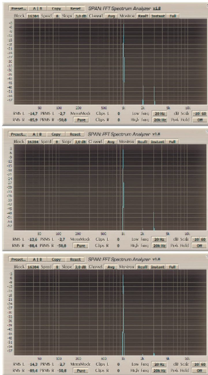
Abb. 2: Der Netzteilregler wirkt auf das Zerrverhalten der Schaltung. In Minimalstellung (oben) treten die K2-Anteile stärker hervor. Die K3-Anteile bleiben nahezu konstant. Ab der Mittelstellung (mittlere Abbildung) tut sich nur noch wenig.

15 dB-A liegt. Für die angestrebten Vokalanwendungen ist die Rauschmut des Horch RM4 vollkommen ausreichend. Etwas kritisch wird es lediglich, wenn es mit leisen Quellen zu tun hat und der Netzteilregler sich in der Nähe des Linksanschlages befindet, denn hier steigt das Rauschen hörbar an. Schon ab 9-Uhr-Stellung ist aber alles okay. Am besten klingt das RM4 bei naher Besprechung. Der prononcierte, aber nicht über-