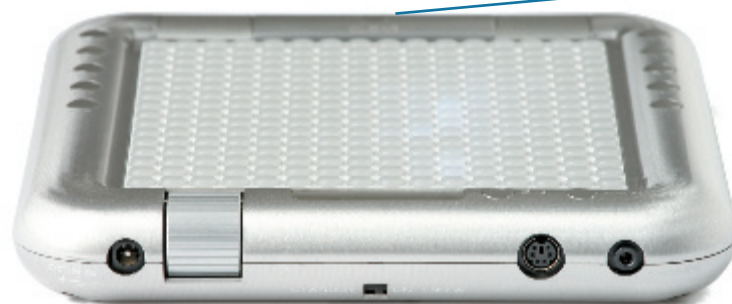
Die Anschlüsse für Netzteil, Kopfhörer und MIDI sowie der Standby-Schalter befinden sich auf der Stirnseite des Tenori-on.

Das Tenori-on bietet keinen Dynamik-Parameter, wie er üblicherweise durch MIDI-Velocity realisiert wird. Lädt man beispielsweise einen Satz Drumsamples, muss man