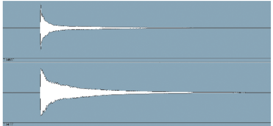
Derselbe Triangelschlag bei angeglichenem Spitzenpegel: Das TLM 67 erscheint deutlich lauter als das TLM 103.

halbderter Halbleitertechnik nachzubilden. Wie soll das gehen? Nun, das genaue Rezept liegt vermutlich in einem Berliner Tresor, aber ein Blick auf das Datenblatt gibt wertvolle Hinweise. Der Grenzschalldruckpegel bezeichnet den Pegel, bis zu dem ein Mikrofon mit sehr geringer harmonischer Verzerrung arbeitet. Gewöhnlich wird ein Klirrgrad von 0,5 % als Grenzwert herangezogen. Das TLM 67 erreicht diesen Grenzwert bereits bei 105 dB-SPL (in Nierenstellung) – ein ungewöhnlich niedriger Wert. Zum Vergleich: Der Grenzschalldruckpegel des TLM 103 liegt bei üppigen 138 dB-SPL. Der viel niedrigere Grenzschalldruckpegel des TLM 67 ist natürlich kein Fauxpas, sondern Teil des Klangdesigns, und um das zu unterstreichen, gibt Neumann noch einen zweiten Wert an, nämlich den Grenzschalldruckpegel bei einem Klirrgrad von 5 %, den das Mikrofon bei 125 dB-SPL erreicht – dieser Wert liegt in dem Bereich, den „herkömmliche“ Mikros bei 0,5 % erreichen. Was sagt uns das? Nun, während übliche Transistorelektroniken sehr abrupt von quietsche-clean zu grässlich-